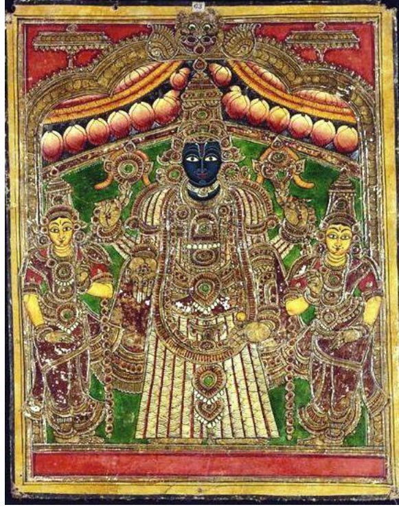
శ్రీదేవి భూదేవి సమేతులైన శ్రీవేంకటేశ్వరుడు. 1850 కాలపు తంజావూరు పటచిత్రం.

శ్రీ శంకరులు - అర్చిష్మంతో తదీయేన అర్చిషా చంద్ర సూర్యాదయః, స ఏవ ముఖ్య అర్చిష్మాన్. శ్రీమన్నారాయణుడే సకల తేజమునకు మూలము. సూర్య చంద్రాదులు ఆయన కాంతివల్లనే ప్రకాశించుచున్నారు. ఆయనే సూర్యచంద్రాదులకు అంతర్యామి గనుక అర్చిష్మాన్.