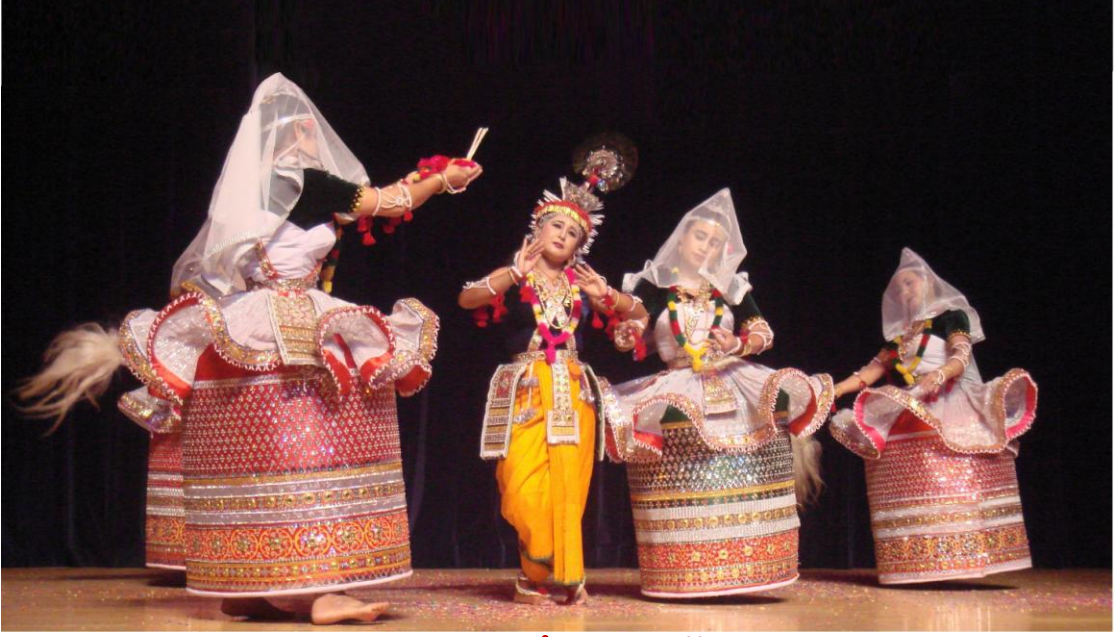
మణిపురి నృత్యశైలిలో రాసలీల నృత్యం.