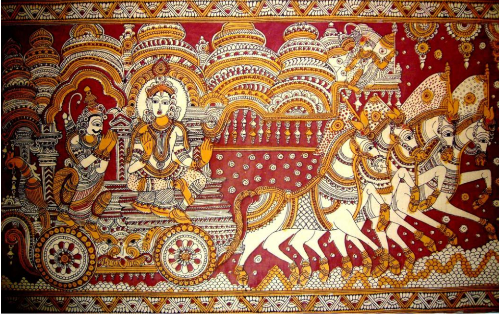
గీతోపదేశము. కలంకారీ చిత్రము.

సచ్చిదానంద పరబ్రహ్మమునందు అభిన్నభావముతో స్థితుడగుటకు పాత్రుడగును. సచ్చిదానంద ఘనబ్రహ్మాయందు ఏకీభావస్థితుడై ప్రసన్నమనస్కుడైన యోగి దేనికిని శోకింపడు, దేనినీ కాంక్షింపడు. సమస్త ప్రాణులయందును సమభావముగల అట్టి స్థితిని చేరిన యోగి నా పరాభక్తిని పొందును.