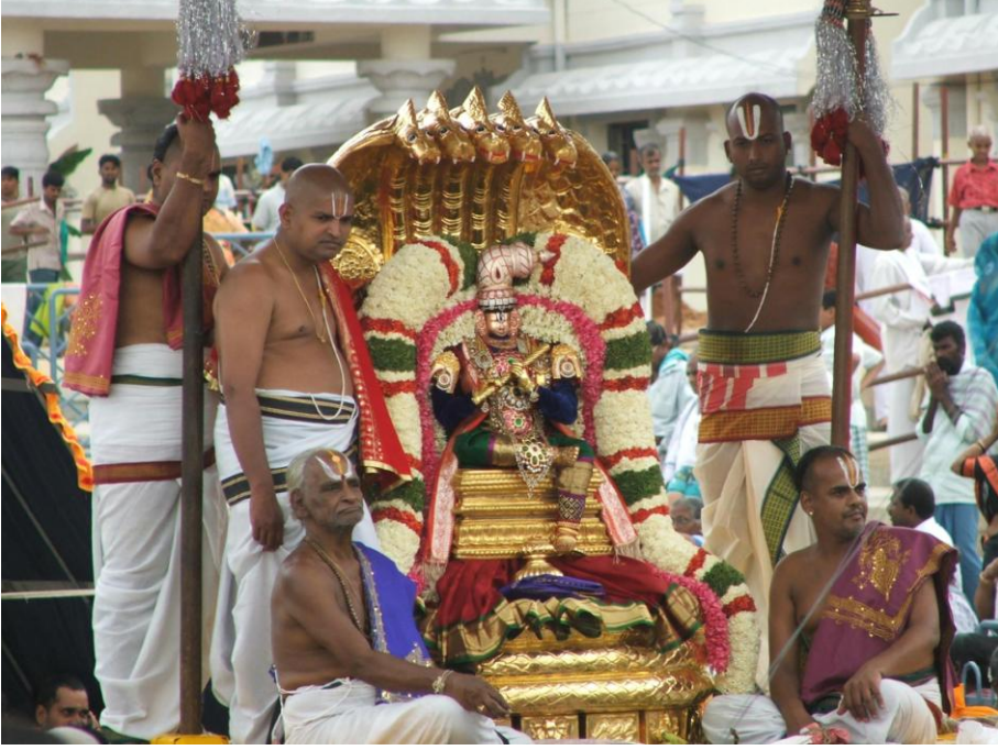
చిన్న శేషవాహనంపై ఊరేగుతున్న శ్రీ మలయప్ప స్వామి.

లక్ష్మీవల్లభత్వమనే సౌభాగ్యచిహ్నమైన శ్రీవత్సము అనే చిహ్నాన్ని వక్షస్థలమున కలవాడు