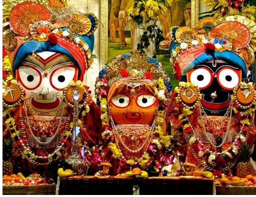
బలభద్రుడు, సుభద్ర, జగన్నాధుడు.

ధర్మచక్రము రచయిత - ఆగమములు, వేదములు వంటి దర్శనములు భగవంతునిచే స్వయముగా ప్రసాదింపబడినవి. వాటిద్వారా జ్ఞానాన్ని పొంది భగవంతునివైపు ప్రయాణం సాగింపవచ్చును.