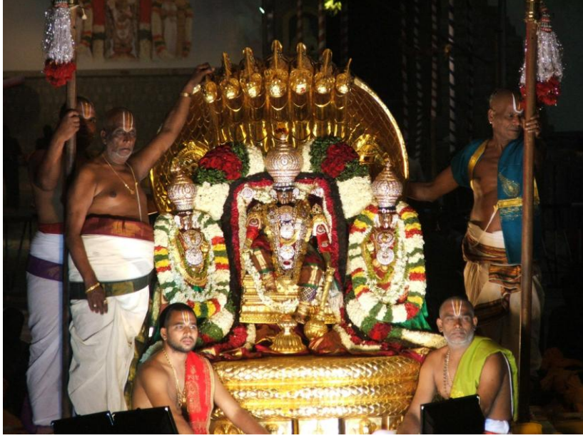
ఉభయదేవేరులతో కూడి పెద్దశేషవాహనంపై ఊరేగుచున్న మలయప్ప స్వామి.

ధర్మచక్రము రచయిత - భగవంతుడు మానవులకిచ్చిన అమూల్యమైన బహుమతి 'సమయం'. ఇది గడిస్తే మళ్ళీ తిరిగిరాదు. కనుక మనకున్న సమయాన్ని భోగలాలసలో వ్యర్థం చేయకుండా, పూర్వకర్మల బంధాలను విముక్తి చేసుకోవడానికి, కొత్త బంధాలు రాకుండా ఉండడానికి వాడుకోవాలి. అలా సమయాన్ని సద్వినియోగం చేసుకొన్నవారు భగవంతుని అనుగ్రహంవలన మోక్షాన్ని పొంది కాలానికే అతీతులౌతారు.