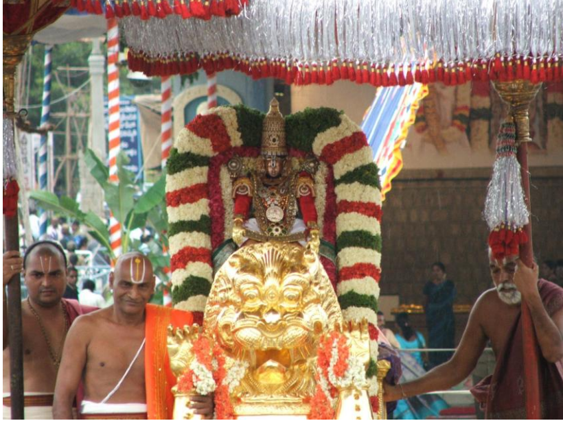
సింహవాహనంపై ఊరేగుతున్న శ్రీ మలయప్పస్వామి.

త్యర్ - ప్లవన సంతరణయోః - దాటుట, ఈడుట. సంసారసాగరంలో పడి కొట్టుమిట్టాడుతున్న జీవులను ఆ సాగరం దాటించేవాడు 'తారః'.