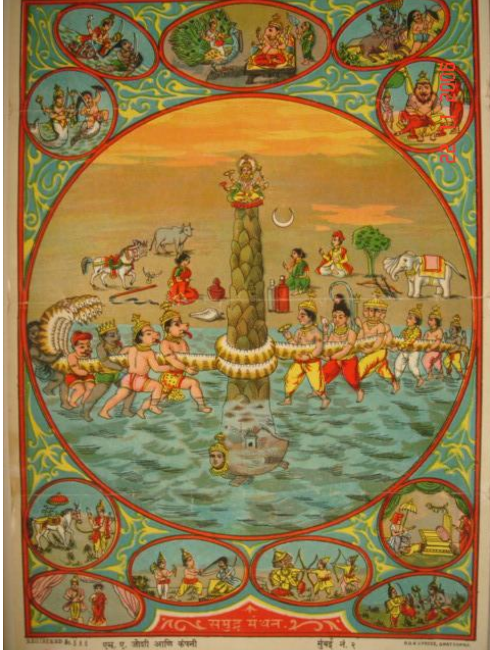
సముద్ర మధనం. 1910 కాలపు చిత్రం. వికీపీడియానుండి.

శ్రీ శంకరులు, శ్రీ భట్టులు కూడా ఈ నామమునకు 'లోక కళ్యాణార్థము యజ్ఞమును సృష్టించినవాడు' అనే అర్థాన్ని చెప్పారు.