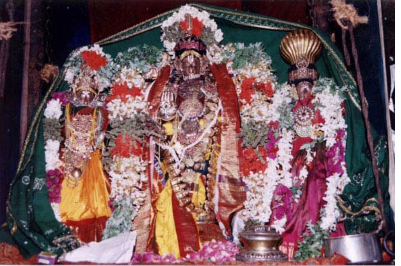
திருநகரி பெருமாள்

என் மனதில் புகுந்த உன்னை என்றும் விடமாட்டேன் .நீ என் மனதை விட்டு அகல ஸம்மதிக்க மாட்டேன் என்ற தீர்மானத்தை மற்றும் ஒரு பாசுரத்தில் “ ,உன்னடியேன் மனம் புகுந்த ,அப்புலவ !புண்ணியனே !புகுந்தாயைப் போகலொட்டேன் ” என்ற விதமாக சொன்னார்.