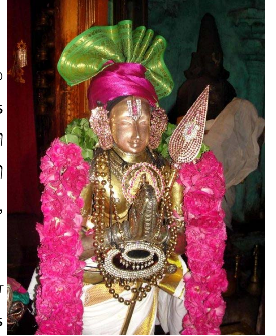
திருமங்கையாழ்வார் - திருவாலி (ருன்றி); ராமாநுஜ தாசர்கள்/ pbase.com)

( 4 ) திருத்தேவனார் தொகை (கீழைச்சாலை மாதவப் பெருமாள் கோயில்): ஸ்ரீ