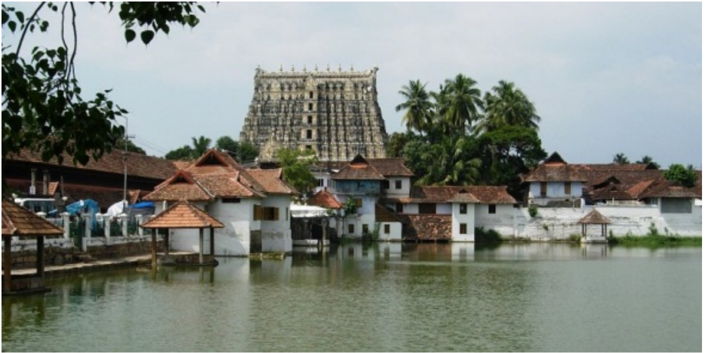
திருவனந்தபுரம் திருக்கோவில்

இப்படியாக அனந்தபுரத்து ஆதியை, நமது துன்பங்கள் துடைக்கும் நேசனை, “நெறிமையால் மலர்கள் தூவி பூசனை” செய்யுமாறு உபதேசித்த பரமாசார்யனின் அருள் மார்க்கத்தை நாமும் கடைபிடித்து உய்வோமாக! ஓம் ஸ்ரீஹரிலக்ஷ்மி ஸமேத ஸ்ரீ பத்மநாப ஸ்வாமினே நம: ஸ்ரீ அ(ஆ)னந்த பத்மனாபன், ஹரி லக்ஷ்மி திருவடிகளே சரணம் என்று வணங்கிக் கொண்டு, அடுத்த மலைநாட்டுத் திருப்பதிக்கு செல்வோம்.