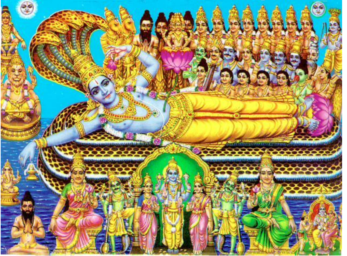
ஸ்ரீ அநந்தபத்மநாப ஸ்வாமி - திருவனந்தபுரம்

http://m.youtube.com/?reload=7&rdm=10dvl21ai#/watch?v=kH_EVmIL3LE