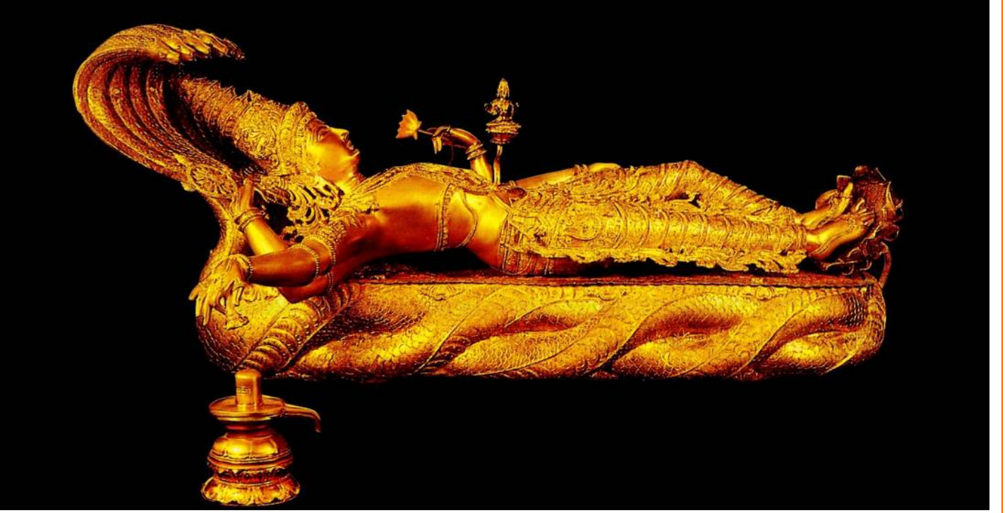
திருவனந்தபுரம் ஸ்ரீ அநந்தபத்மநாபஸ்வாமி

திண்ணம் நாமறியச் சொன்னோம் செறிபொழில் அனந்தபுரத்து, அண்ணலார் கமலபாதமணுகுவார் அமரர் ஆவர்.